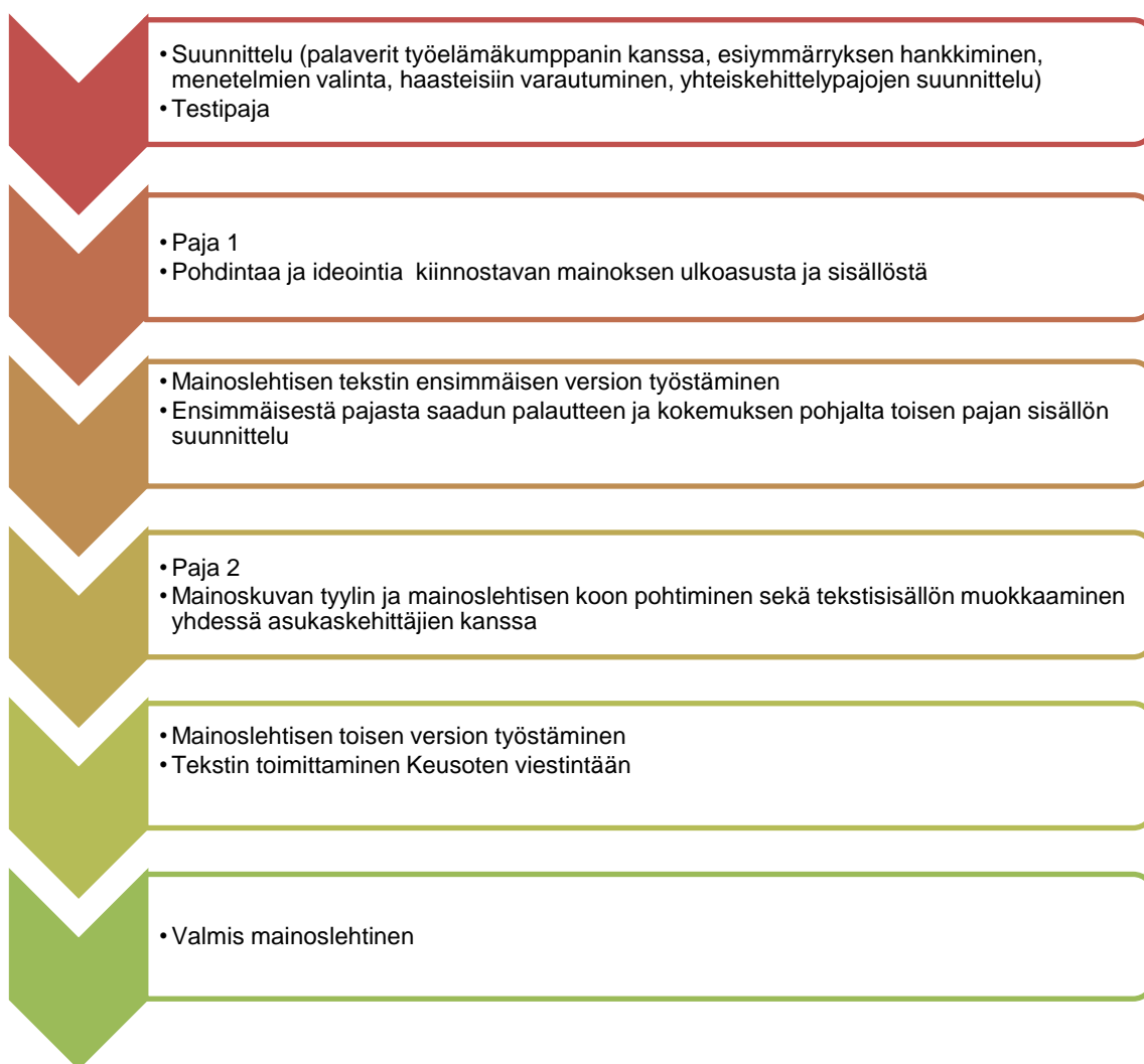
Taulukko 1. Prosessin kuvaus

Opinnäytetyön tekeminen ideavaiheesta valmiiseen työhön kesti yhteensä noin 14 kuukautta. Prosessin kuvaus- kaaviossa esitetty mainoslehtisen suunnittelu ja toteutus kesti noin kahdeksan kuukautta. Pajat toteutettiin tiiviillä aikataululla kahdessa viikossa ja muu aika suunniteltiin pajoja, työstettiin mainoslehtiseen liittyviä yksityiskohtia sekä kirjoitettiin opinnäytetyön tekstiosuuksia.