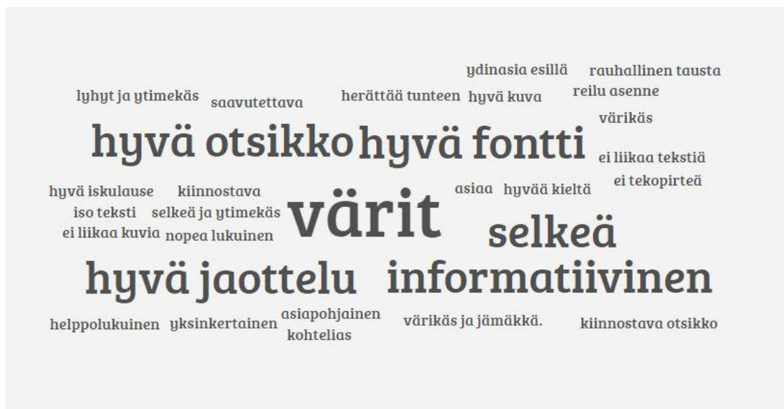
Kuva 1. Asukaskehittäjien mietteet kiinnostavan mainoksen piirteistä

Asukaskehittäjillä oli hyvin samankaltaisia näkemyksiä, kuin kirjallisuudessa on esitetty (kuva 1). Työskentelyn lomassa käydyssä keskustelussa asukaskehittäjät korostivat tekstin erottuvuuden merkitystä: fontin muoto ja koko sekä mainoksen taustaväri olivat tärkeitä luettavuuden kannalta. Näiden lisäksi informatiivisuus sekä selkeys koettiin tärkeinä piirteinä kiinnostavassa mainoksessa.