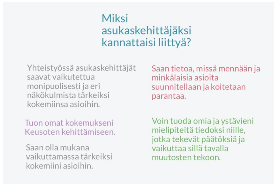
Kuva 3. Asukaskehittäjien mietteitä asukaskehittäjätoiminnasta

Flingassa ohjeistimme käyttämään tekstimuotoa edellisellä kerralla käytettyjen neliö- ja pallomuotojen sijaan. Keskustelimme, miten tarkkaan asukaskehittäjät haluavat kertoa itsestään mahdollisesti esitteeseen tulevassa tekstissään. Kerroimme erilaisista vaihtoehtoista ja keskustelu kävi aiheesta vilkkaana. Osallistujat olivat yksimielisiä siitä, että oman nimen, iän sekä paikkakunnan kertominen tuo luotettavuutta ja he halusivat saada ne näkyviin. Jokainen kirjoitti näkemyksensä valkotauluun ja lopuksi osallistujat äänestivät mielestään parasta lausahdusta (kuva 2).