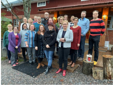
Keusoten ohjaajat ja kouluttajat kouluttautumassa.

Suurena työnantajana pystymme tarjoamaan monipuolisen työnkuvan ja koulutuksen.