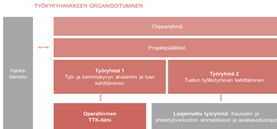
Kuva 4. Hankkeen organisoituminen.

Työkykyhanketta hallinnoi Keski-Uudenmaan sote -kuntayhtymä. Hanke toteutetaan Keusoten alueella, johon kuuluu kuusi kuntaa: Hyvinkää, Järvenpää, Mäntsälä, Nurmijärvi, Pornainen ja Tuusula. Kuntien työllisyyspalvelut, Uudenmaan TE-toimisto, Keski-Uudenmaan TYP ja Kela osallistuvat hankkeeseen tiiviisti yhteistyökumppaneina. Hankkeen organisoituminen on esitetty alla.