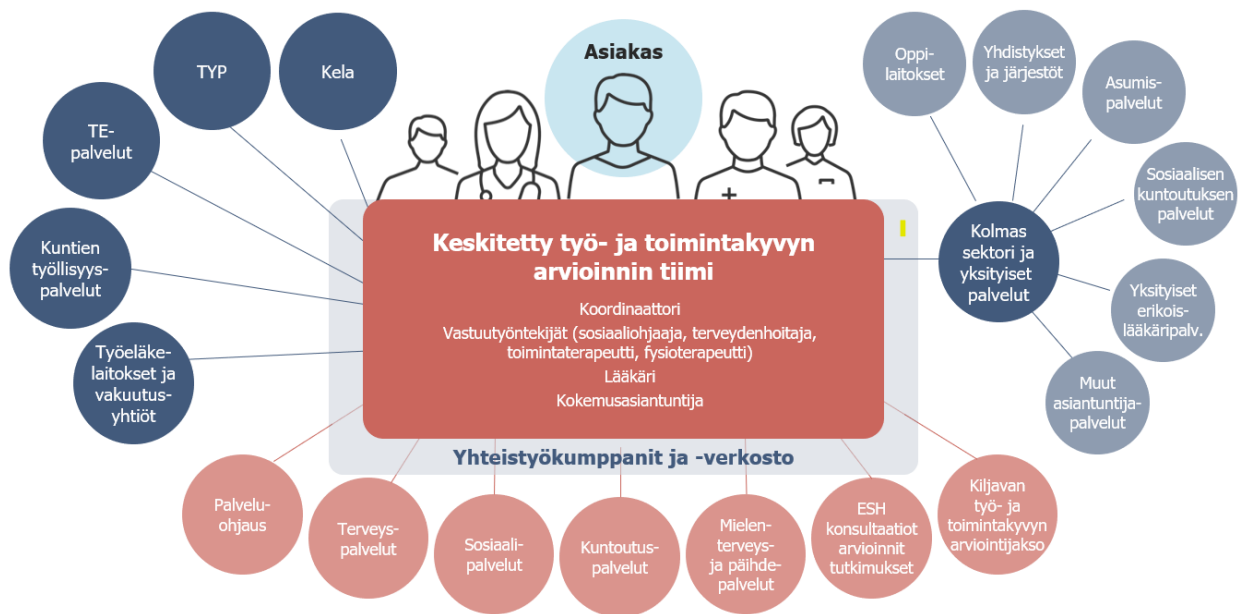
Kuva 2. Keskitetty työ- ja toimintakyvyn arvioinnin tiimi sekä yhteistyöverkosto.

TTK-tiimin jäseniksi kiinnitetään työ- ja toimintakyvyn arviointiin erikoistunut, osaava joukko ammattilaisia. Alustavan suunnitelman mukaan tiimin kokoonpanoon kuuluvat koordinaattori, vastuutyöntekijät (sosiaaliohjaaja, terveydenhoitaja ja toimintaterapeutti ja fysioterapeutti, lääkäri ja kokemusasiantuntija. TTK-tiimi selvittää asiakkaan työ- ja toimintakyvyn tuen tarpeen yhdessä Keusoten sisäisen ja ulkoisen yhteistyöverkoston kanssa (ks. kuva 2 alla).